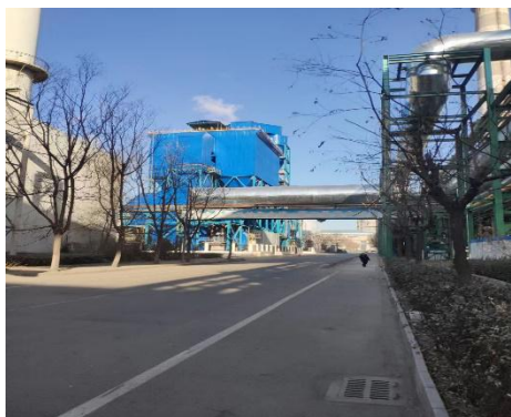
迁钢公司 3#高炉脱硫脱硝项目

按政府部门要求，迁钢公司积极开展超低排放治理项目建设，对照超低排放标准，持续实施高炉热风炉烟气治理、热轧部加热炉增加脱硝设施等治理项目，继续保持公司在全国钢铁行业的环保标杆形象。