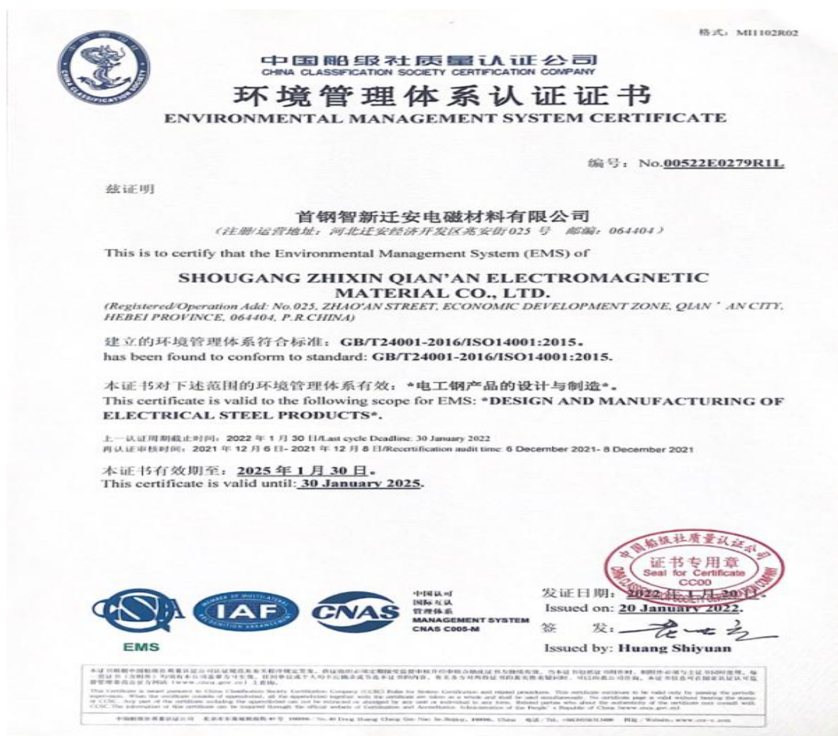
表1 ISO14001环境管理体系认证情况表

体系》要求，策划组织实施环境管理体系认证，2019年1月首次通过了ISO14001环境管理体系认证。2022年1月20日环境管理体系通过了中国船级社质量认证公司ISO14001体系换证审核。2022年12月，通过了ISO14001环境管理体系年度监督审核。