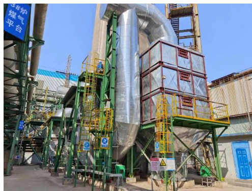
迁钢公司加热炉脱硝项目

2022 年，京唐公司锚定目标，有组织升级改造项目按时间节点完成，推进实施热轧加热炉脱硫、高炉热风炉烟气脱硝等多项环保深度治理项目，污染物排放持续保持环保绩效 A 级企业水平。